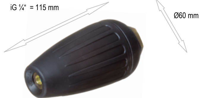
MonoWhirl 400 Soft

Unter Verwendung eines Softstartsystem bei druckloser HD-Leitung (langsamer Druckaufbau)