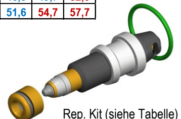
Rep. Kit (siehe Tabelle)

* Alternativ Anschlußgewinde mittels Anschluss-Übergangsadapter verfügbar.