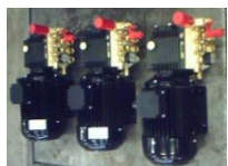
H 2 O Motorpumpe-4