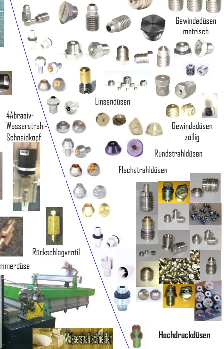
4Abrasive- Wasserstrahl- Schneidkopf