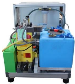
H 2 O Powerset-II